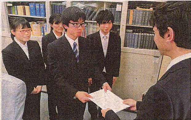
選挙公報を発行するよう求める提言書を県選管の担当者へ渡す学生たち＝県庁で

県内の大学生有志らが選挙の投票率アップに向けた有効策の一つとして、立候補者の政策や経歴などを紹介する「選挙公報」を県議選でも発行するよう求める提言書を県選管や議長あてに出した。学生たちは「選挙公報は、覧して候補者を比較できるので、投票先を選ぶのに役立つ」と話している。(奥田哲平)